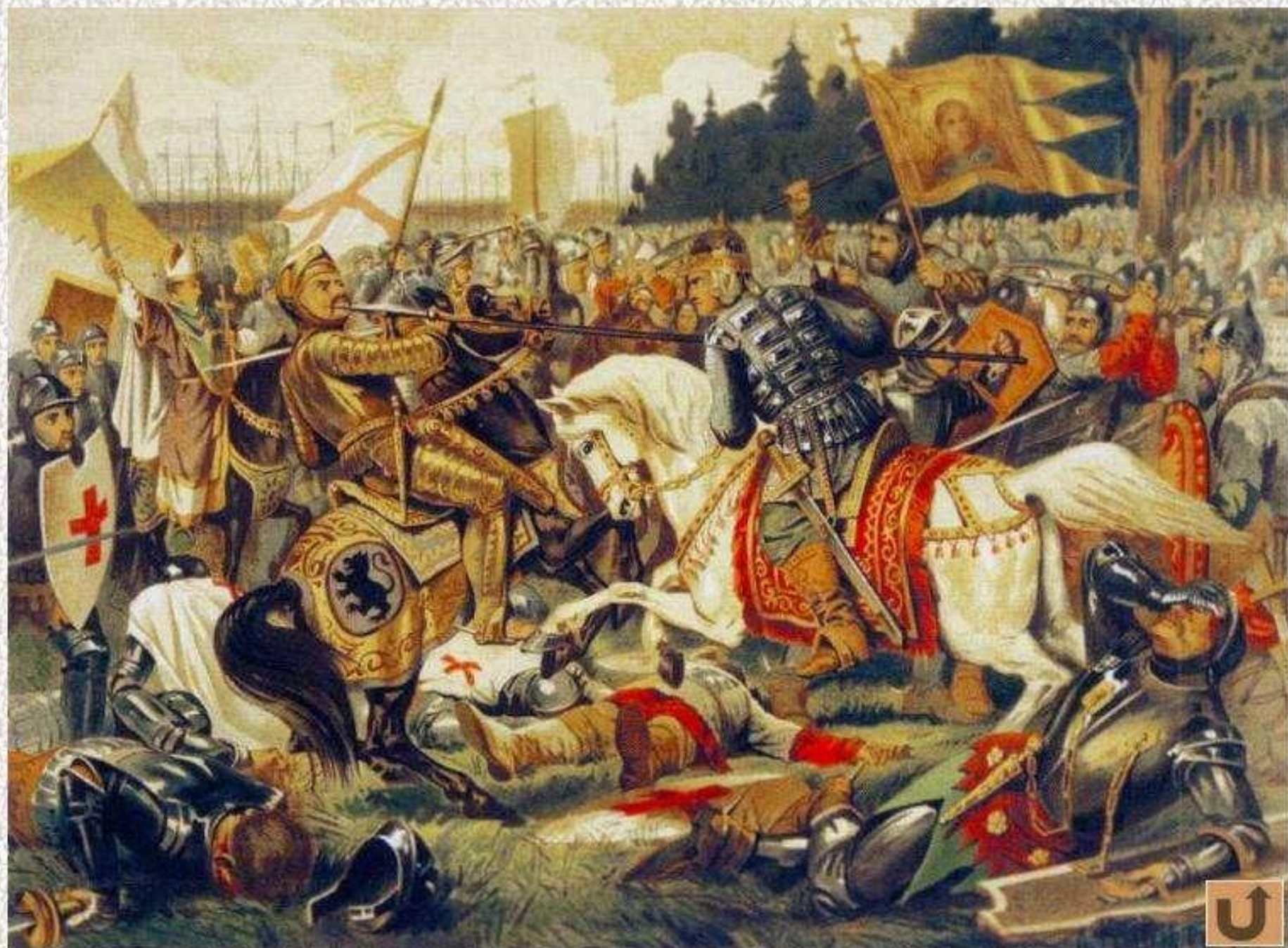
Святой благоверный князь Александр Невский наносит рану в лицо Биргеру.